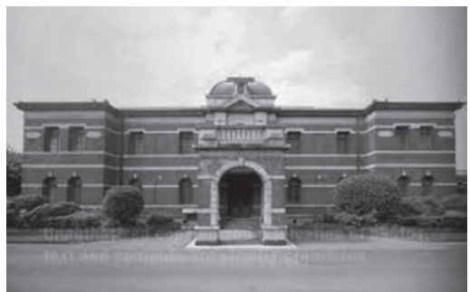
官営八幡製鉄所旧本事務所(同左)