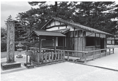
松下村塾(「文化遺産オンライン」)

問4 下線部①に関連して、2015年に指定された「明治日本の産業革命遺産」を構成する次の文化遺産についての問いに答えなさい。